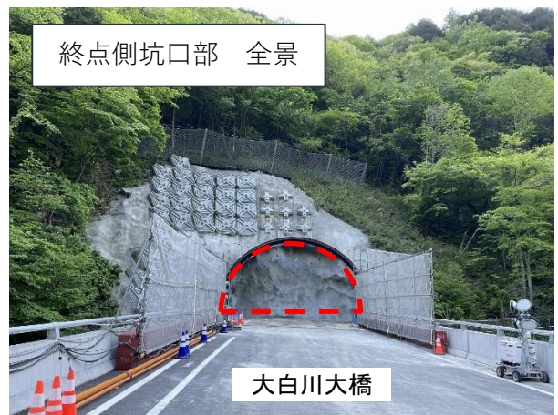
終点側坑口部 全景