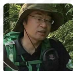
サトウ マサヒロ 佐藤正広

Web: Photographino.com Instagram: @hino_