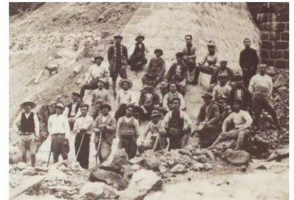
砂防事業に従事した地域住民 (昭和30年代)

家や道路などを壊し、人の命を奪う恐ろしい土砂災害から人命・財産を守るための事業を「砂防」と呼び、その工事に携わる人々を敬意を表して「砂守」と呼んでいます。《飛騨の砂守ツアー》では、北アルプスの大自然の中、普段間近に見ることのない砂防堰堤などを巡り、地域住民・砂守の土砂災害との闘いの歴史を学びながら奥飛騨の魅力を体験できるツアーです。