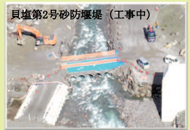
貝塩第2号砂防堰堤 (工事中)