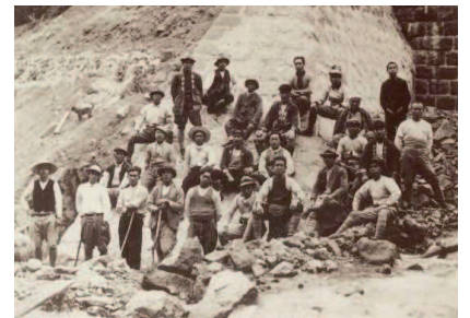
砂防事業に従事した地域住民 (昭和30年代)

家や道路などを壊し、人の命を奪う恐ろしい土砂災害から人命・財産を守るための事業を「砂防」と呼び、その工事に携わる人々を敬意を表して「砂守」と呼んでいます。《飛驒の砂守ツアー》では、北アルプスの大自然の中、普段間近に見ることのない砂防堰堤などを巡り、地域住民・砂守の土砂災害との闘いの歴史を学びながら奥飛驒の魅力を体験できるツアーです。