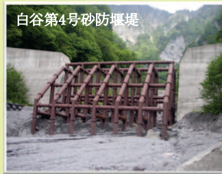
白谷第4号砂防堰堤